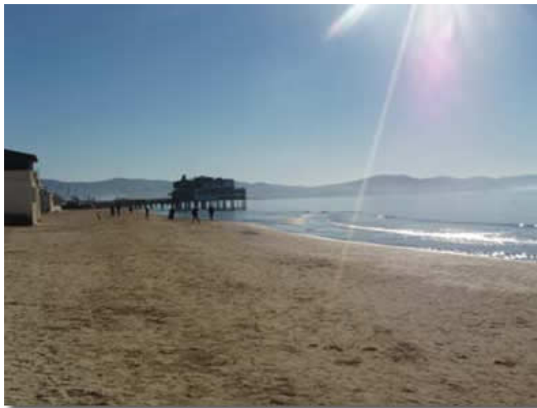
Follonica Gennaio 2006