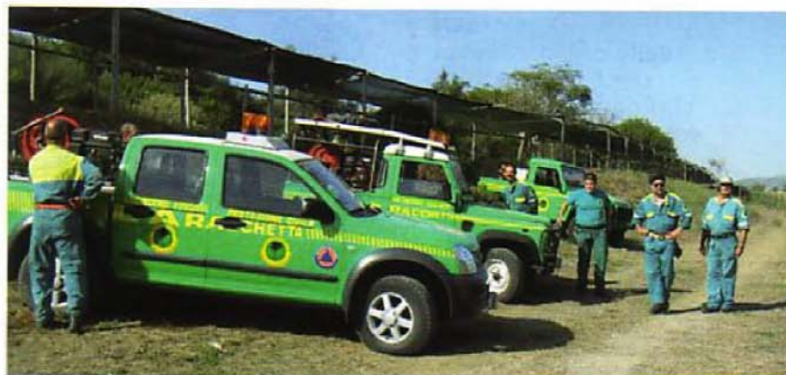
Uno scorcio del campo scuola della Protezione civile della Provincia di Grosseto