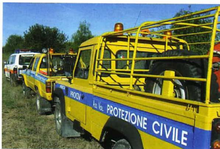
Automezzi in dotazione alla Protezione civile provinciale